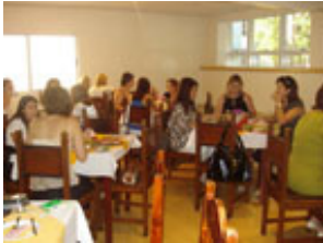
1º Café da Manhã Empresarial