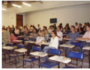
Seminário: Nota Fiscal Paulista