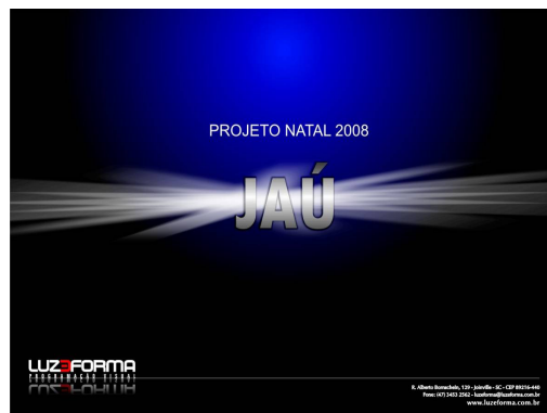
PROJETO NATAL 2008

Segundo os comerciantes os resultados superaram as expectativas, o que reforça a escolha do mês de julho como sendo ideal para a realização do próximo evento.