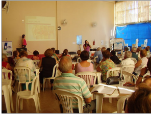
Oficina de Voz, Memória e Audição