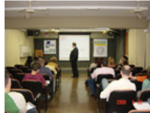
Venda Melhor: Dias das Mães