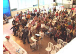
Palestra: Prevenção Contra Sequestro