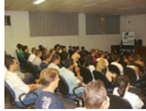
Seminário: Venda Certo