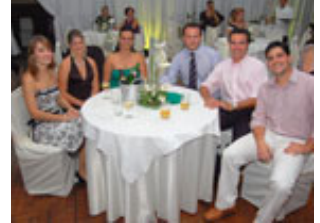
1º Jantar Dançante