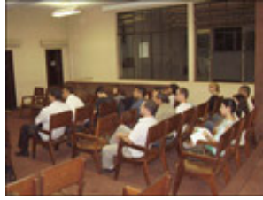
Palestra: Análise de Mercado